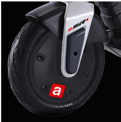
Ruote Tubeless da 10"