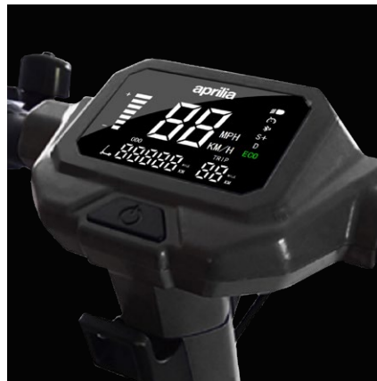
Ampio display LED da 3.5"